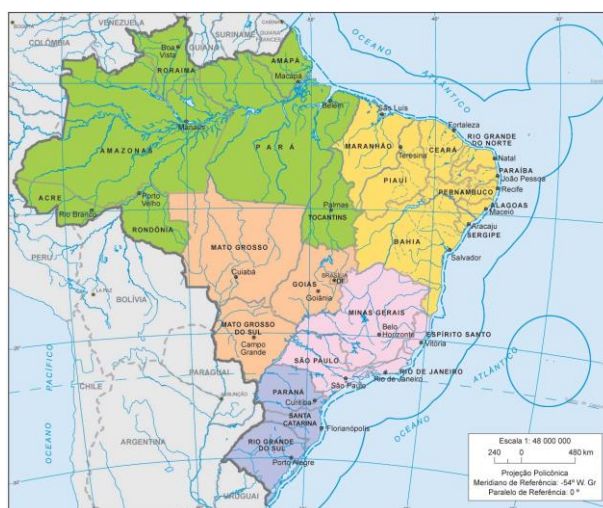
Figura 1 - Mapa do Brasil.

Os países envolvidos nesta pesquisa são Brasil (Figura 1) e Honduras (Figura 2) ambos estão localizados na América Latina, com uma extensão territorial de 8.516.000 km 2 e 112.492 km 2 respectivamente. (UNITED NATION, 2017).