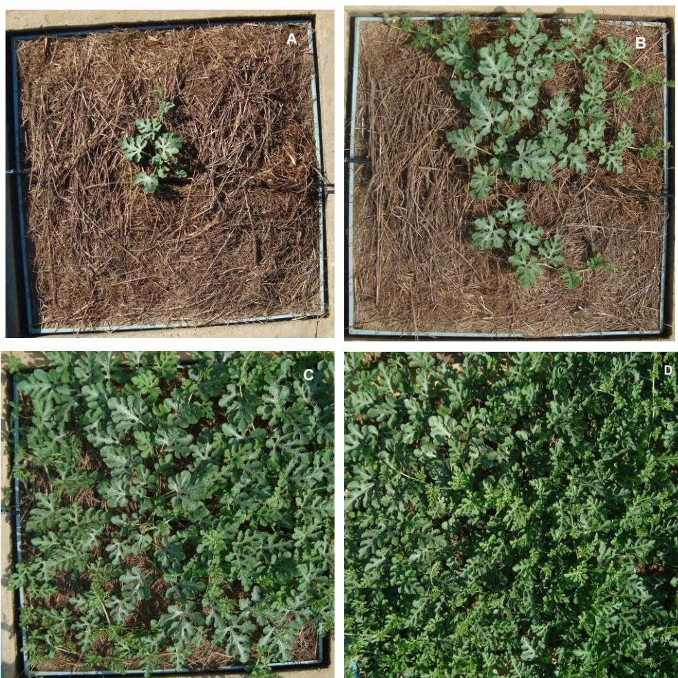
Figura 1. Área foliar da melancieira em diferentes fases de desenvolvimento da cultura. Fases: A – 19 DAS; B – 26 DAS; C – 33 DAS; D – 40 DAS. DAS – dias após semeadura.

Para efeito do cálculo dos Kc's médios, o ciclo da cultura foi dividido em quatro fases fenológicas, definidas da seguinte forma: I) fase inicial: do plantio até 10% de cobertura do solo; II) fase de crescimento: do final do estágio inicial até 80% de cobertura do solo; III) fase intermediária: de 80% de cobertura do solo até o início da maturação dos frutos; IV) fase final: do início da maturação até a colheita dos frutos.