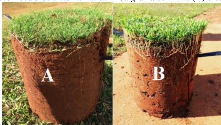
Figura 3. Aspectos visuais do sistema radicular da grama bermuda (A) e esmeralda (B).

A exemplo do que ocorreu na massa seca de raízes do vaso, também nas raízes aderidas ao geotêxtil a grama bermuda não