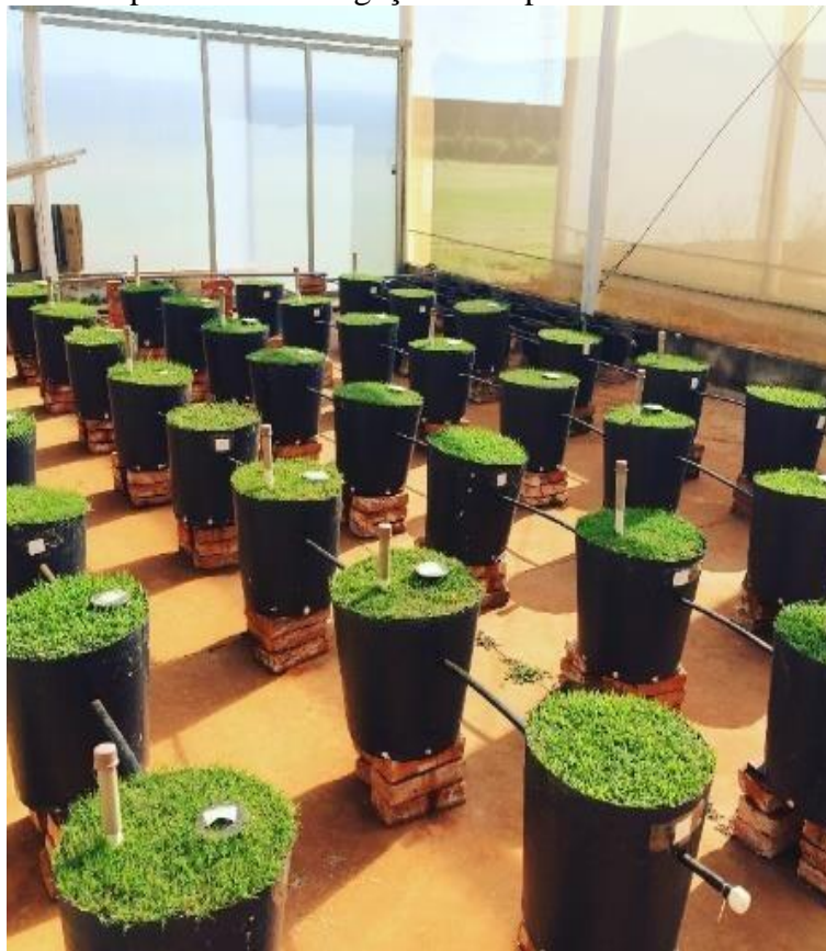
Figura 1. Experimento implantado em irrigação subsuperficial.

O solo utilizado no experimento foi classificado como Latossolo Vermelho distrófico (LVd) de textura média, desse total de vasos, vinte e quatro foram selecionados para inserção do tubo acrílico, para avaliar o desenvolvimento do sistema radicular das gramíneas com equipamento scanner CI-600 e software Winrhizo que trabalha sob Ms. Windows e usa uma esqueletização para medir os parâmetros de raiz.