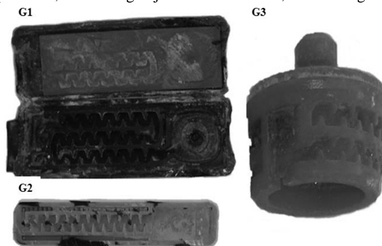
Figura 1. Gotejadores após 400 horas de operação, G1 D5000 Flow Regulated Drip Line autocompensante; G2 Tubo gotejador NaanDanJain; G3 Botão gotejador Irritec.

Na Tabela 3, são apresentados os valores de vazão média, em L h -1 . Os emissores G1 e G2 demonstraram maior resistência ao entupimento ao longo do tempo de operação, sendo que