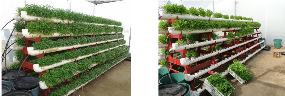
Figura 1. Módulo hidropônico de baixo custo utilizado na produção do coentro

O semeio foi efetuado em copos descartáveis de 200 mL, perfurados nas laterais a partir do último terço do comprimento do copo e no fundo, bem como preenchidos com fibra de coco úmida. Com auxílio de um borrifador manual, pulverizou-se água de abastecimento municipal de Campina Grande-PB ( CE = 0,85 \text{ dS m}^{-1} e \text{pH} = 7,06 ) três vezes ao dia, até a germinação completa em todas as células.